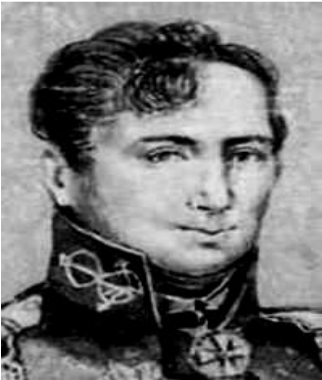
Лаптев Харитон Прокофьевич