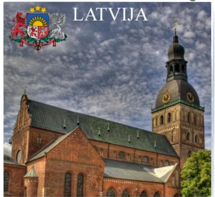
Rīga - Rīgas Doms